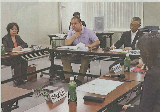
空き家対策について議論を交わした検討委の初会合

長年放置され倒壊の恐れなどがある空き家への対応を審議する「札幌市空き家対策検討委員会」の初会合が3日、市役所で開かれた。