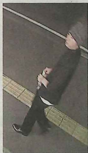
防犯カメラに写った容疑者の男の画像

札幌市東区のコンビニエンスストア「セイコーマート元町駅前栄ビル店」で2日深夜、ナイフのようなものを持った男が現金を奪おうとした強盗未遂事件で、札幌東署は3日、店の防犯カメラに写っていた容疑者の男の画像を公開した。